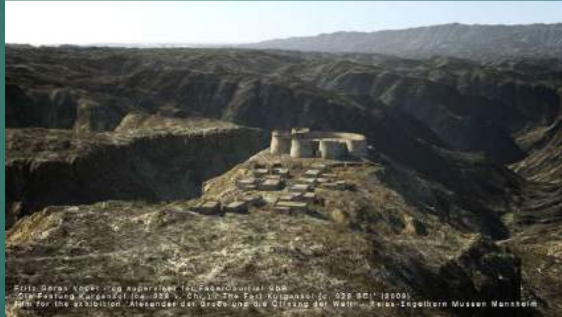
Die Festung Kurgankol (ca. 1228 v. Chr.) / The Fort Kurgankol (c. 1228 BC) (1909) Bild für die Ausstellung: Alexander der Große und die Öffnung der Welt / Maria-Lopez-Museen Mainz