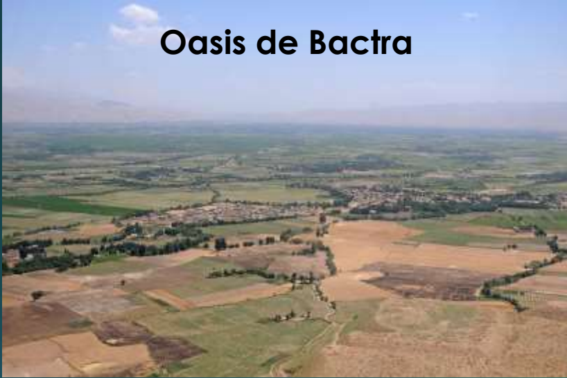
Oasis de Bactra