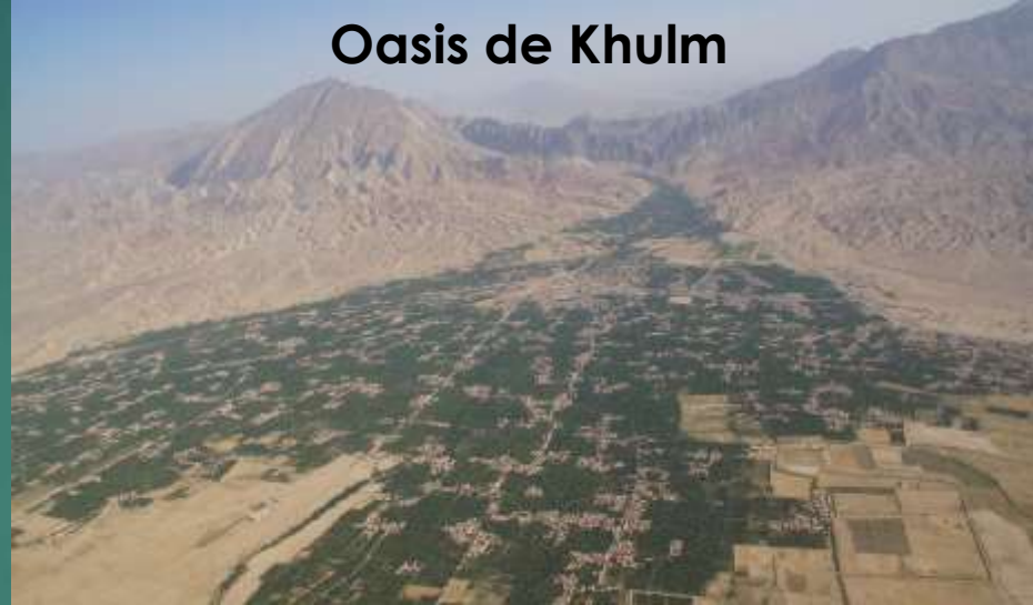
Oasis de Khulm