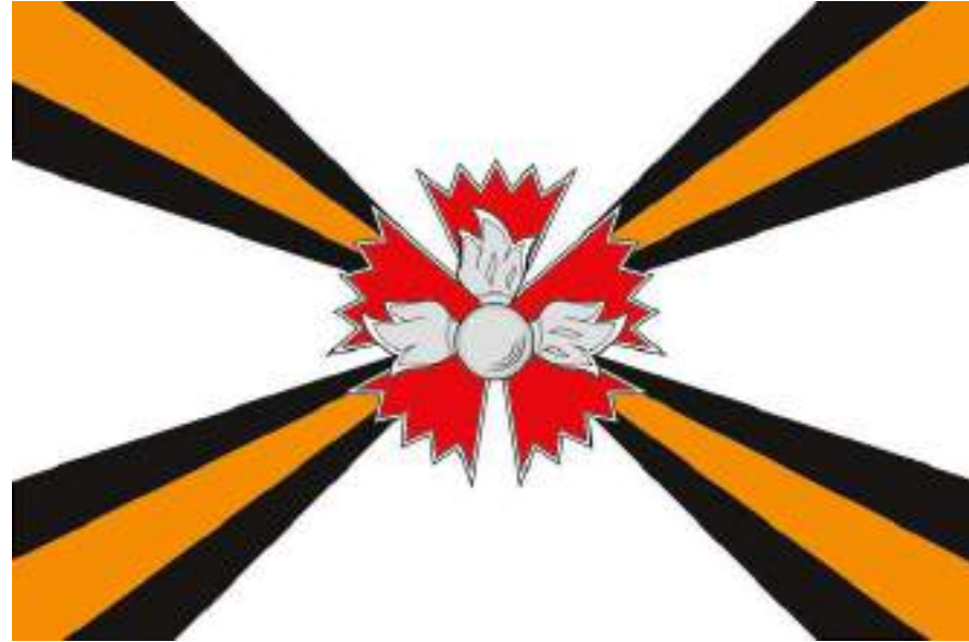
GRU – Directorio Principal del Alto Estado Mayor de las Fuerzas Armadas rusas