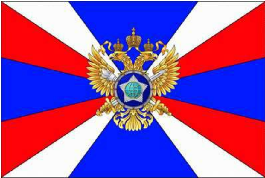
SVR – Servicio de Inteligencia Exterior