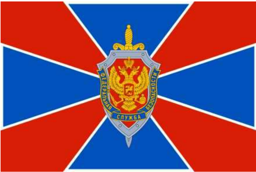
FSB – Servicio Federal de Seguridad